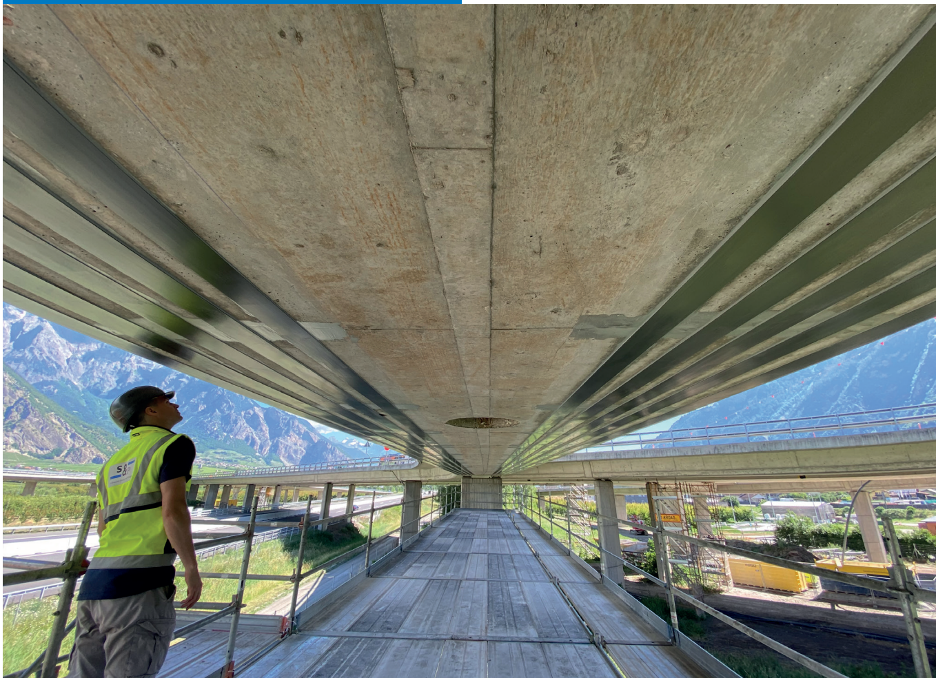
▲ Portée de 26 m renforcée par des lamelles S&P C-Laminate.

Laminate) en sous-face des caissons a pu se faire sans interruption du trafic. Les avantages des lamelles S&P résident dans leur rapidité de pose, leur très haute résistance à la traction et évidemment leur non-corrosivité.