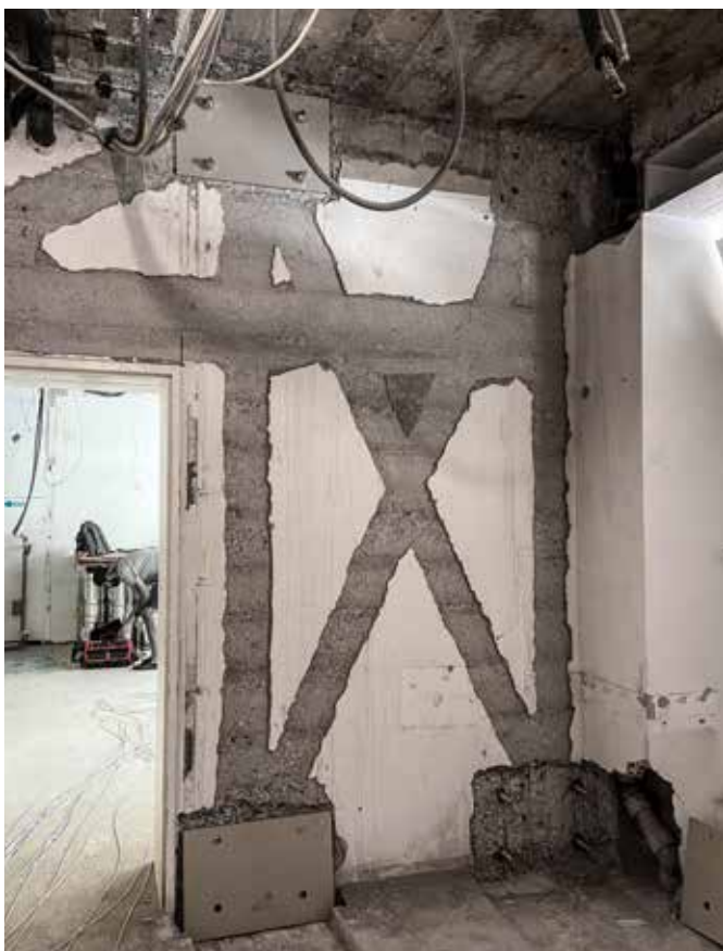
▲ Der Untergrund ist vorbereitet und die ersten Grundplatten für die Metallwinkel sind montiert.

Die Verstärkung mit S&P C-Laminaten stellt aufgrund ihres geringen Gewichts, der einfachen Verlegung und der Langlebigkeit die ideale Lösung für solche Projekte dar.