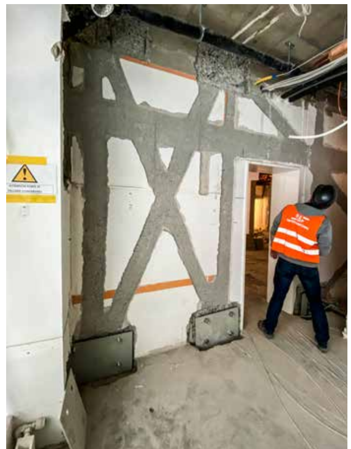
▲ Ein S&P Spezialist überprüft die Qualität und Ausführung der Arbeiten.